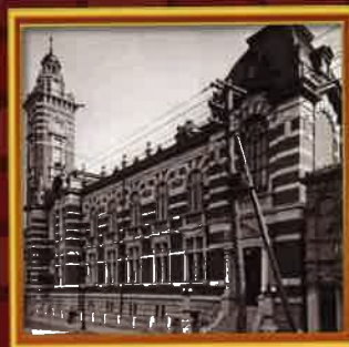
大正6年竣工時の会館