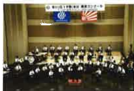
横浜市立仲尾台中学校 吹奏楽部