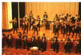
横浜市立港中学校 吹奏楽部

三塔を祝う ~次の100年につなぐ未来への架け橋~ 赤い靴ジュニアコーラス、港中学校・仲尾台中学校の吹奏楽部・横浜市消防音楽隊による4部構成の記念コンサート。