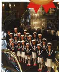
赤い靴ジュニアコーラス

【時間】13:00~15:10 (開場12:30) 【会場】開港記念会館 講堂 【参加方法】当日受付 先着300名 (当日10時より整理券配布)