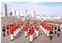
横浜市消防音楽隊