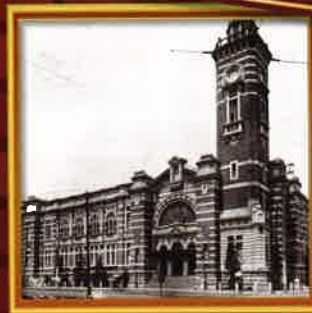
昭和2年再建時の会館

【主催】 中区制90周年・開港記念会館100周年記念事業実行委員会 【協力】 横浜税関・神奈川県・中区社会福祉協議会・岩手県釜石市・熊本県・熊本市・埼玉県飯能市・群馬県嬬恋村・ジャックサポーターズ・日本大通り活性化委員会・横浜三塔協議会・株式会社新日屋・神奈川県家具工業組合かなもく塾・ダニエル株式会社・I.TOON